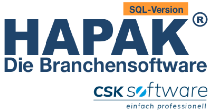
Das modifizierte Logo der HAPAK SQL-Version

Die HAPAK SQL-Version auf Basis der modernen Postgre-SQL Datenbank ist verfügbar. Diese Version steht parallel zur HAPAK V-Version, ist also keine direkte Update-Version hierzu. Es können natürlich die Daten aus der V-Version in die neue SQL-Datenbank per Konvertierung übernommen werden.